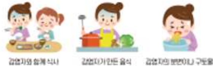
감염자와 함께 식사